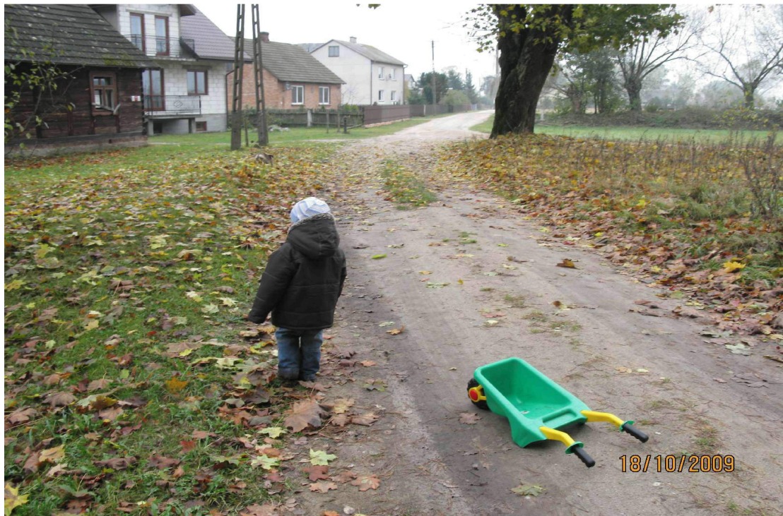
Przyborowie od strony lasu tzw. Bociania