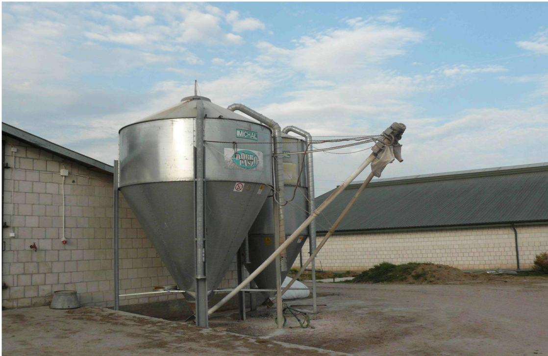
Zbiorniki paszowe jednego z gospodarzy