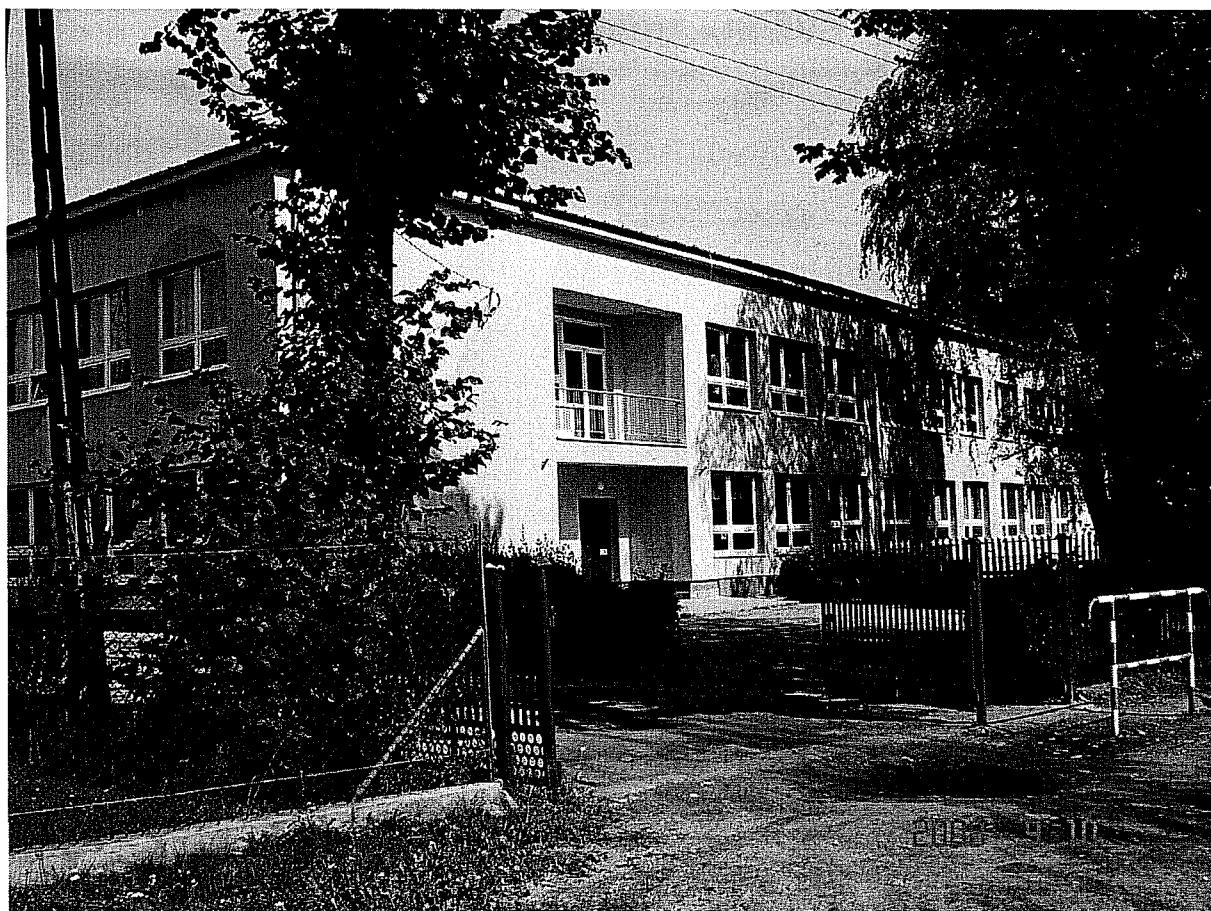
Publiczna Szkoła Podstawowa – Trynosy – Osiedle.